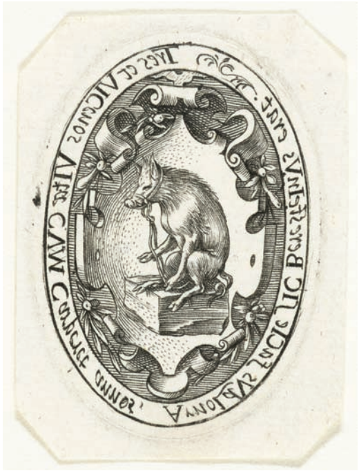
Wapen Van Beresteyn door Goltzius, 1579