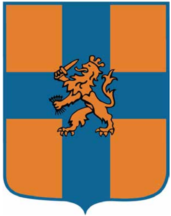
Embleem IGK, ontleend aan de Oranje - vlag. De kleur oranje staat hier voor goud

reeds op uitsterven stond. Volledigheidshalve: op de koninklijk vlag is in iedere hoek nog een hoorn geplaatst).