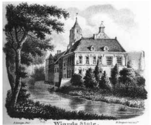
Wiardastate, voor- en achterzijde