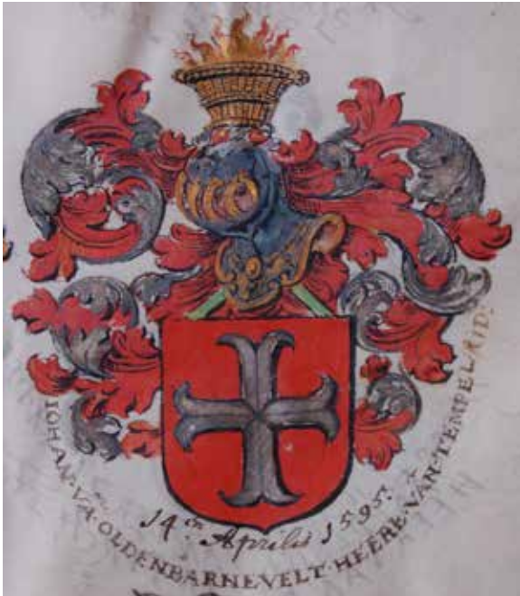
Van Oldenbarnevelt 20

Nederland dankt zijn ontstaan aan een geloofsoorlog. Tot de nationale geschiedenis uit die periode behoort de beschuldiging door prins Maurits, dat Van Oldenbarnevelt landverraad had gepleegd. Na een politiek proces is de staatsman vier eeuwen geleden door onthoofding geëxecuteerd. 21 Hij behoorde tot de rijkste Nederlanders, maar zijn goederen werden grotendeels geconfisqueerd. Diens zoon Reinier van Oldenbarnevelt heeft de gerechtelijke moord op zijn vader willen wreken door (samen met zijn jongere broer Willem) een aanslag op prins Maurits te beramen. Dit kwam echter voortijdig uit. Ook Reinier 'van Groenevelt', zoals hij naar zijn bezit werd genoemd, kreeg nadat hij was opgepakt de doodstraf en werd onthoofd (1623; Maurits verleende aan hem geen gratie).